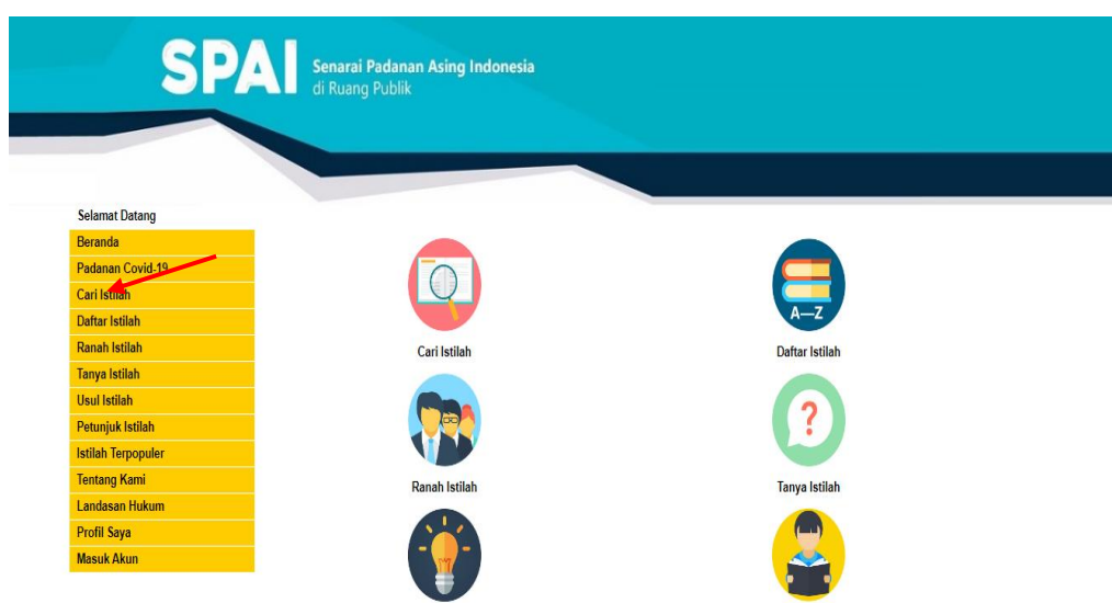
Gambar 1. Tampilan Aplikasi SPAI

Fitur aplikasi SPAI lengkap dan mudah digunakan oleh mahasiswa BIPA. Ada beberapa fitur penting, yaitu: cari istilah, daftar istilah, ranah istilah, tanya istilah, usul istilah, dan petunjuk istilah. Selain itu, tahun 2020 saat pandemi mulai melanda seluruh dunia muncul pencarian tambahan, yaitu padanan covid-19 yang membuat seseorang mudah menemukan padanan istilah asing yang sering digunakan selama pandemi.