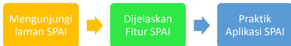
Gambar 3. Tahap Penelitian

Mahasiswa BIPA di kelas bahasa Indonesia mendapatkan materi khusus untuk lebih memahami kosakata dalam bahasa Indonesia. Materi khusus ini diberikan setelah mereka menyelesaikan ujian tengah semester. Pemberian materi khusus dilakukan menggunakan aplikasi Zoom dan membentuk grup WhatsApp khusus mahasiswa BIPA yang dipilih. Peneliti memilih lima orang mahasiswa BIPA yang dianggap masih kurang memahami kosakata asing dalam bahasa Indonesia. Penelitian pertama yang dilakukan oleh peneliti yaitu meminta mahasiswa BIPA untuk membuka aplikasi SPAI melalui laman yang disediakan oleh Kemdikbud.