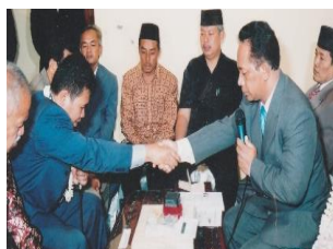
Gambar 9. Ijab kabul

Setelah acara injak telur, kemudian dilanjutkan acara wijikan (cuci kaki). Mempelai wanita mencuci kaki mempelai pria dengan menggunakan air yang dilengkapi dengan kembang setaman atau kembang manca warna (bunga lima warna: kantil, mawar merah, mawar putih, kenanga, dan melati) ( Gambar 12: injak telur dan cuci kaki ). Konteks: acara ini merupakan acara adat Jawa dengan bahasa nonverbal dinamis karena ada aktivitas nonverbal, mempelai wanita mencuci kaki mempelai pria setelah melakukan acara injak telur. Hal ini mengandung makna simbolik bagi masyarakat pemilik budaya itu (Takkaç Tulgar, 2019).