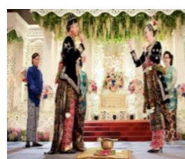
Gambar 11. Lempar gantel