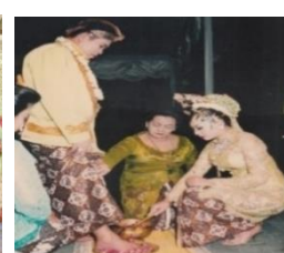
Gambar 12. Cuci kaki