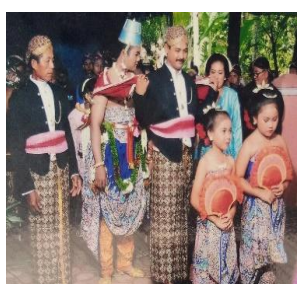
Gambar 13. Sinduran

Meskipun acara ini bersifat mirunggan (mana suka), tetapi justru acara inilah yang akan menjadi citra status sosial keluarga. Semua tamu akan datang satu per satu untuk berjabat tangan dengan kedua orang tua, kedua mempelai, dan kedua besan. Setelah acara berjabat tangan dilanjutkan dengan kembul bujono (makan bersama). Ada yang cara menjamunya dengan prasmanan (mengambil sendiri makanan yang disediakan) dan ada pula yang disajikan satu per satu. Masyarakat Jawa menyebutnya “piring terbang”.