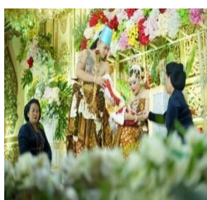
Gambar 14. Kacar-kucur