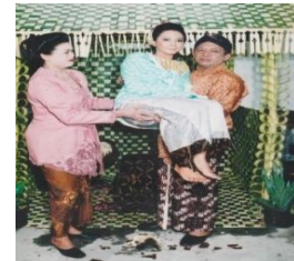
Gambar 4. Bubak Kawah

Pada waktu yang sama dengan pemasangan bleketepe , di tempat lain dilakukan acara siraman . Siramaan diperuntukkan mempelai perempuan, sedangkan mempelai laki-laki dilaksanakan di rumah mereka sendiri. Acara siraman ini dimaksudkan untuk mensucikan diri dari berbagai kotoran, baik kotoran fisik maupun kotoran hati agar ketika menghadapi acara inti ijab kabul dapat terlaksana dengan lancar ( gambar 3: Siraman ). Ketika siraman selesai, mempelai wanita (jika anak sulung) diadakan acara bubak kawah ( Gambar 4: Bubak Kawah ) yaitu sehabis siraman, mempelai wanita dibopong oleh ayahnya dan dibawa ke tempat pelaminan untuk dipaes ( dikerik ) ( gambar 5: Paes ). Acarangerikuntuk membersihkan sinom (bulu-bulu halus yang ada di pelipis) dan alis mata agar saat dipaes ( dirias ) dapat nampak rapi dan cantik. Pada acara ngerik ini dilakukan oleh juru rias. Konteks: acara ngerik sebagai bahasa nonverbal dinamis karena ada aktivitas verbal perias terhadap mempelai perempuan.