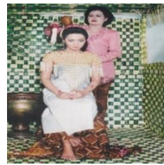
Gambar 3. Siraman