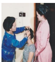
Gambar 5. Paes/Rias

perlengkapan alat sholat, dan pisang sanggan/pisang raja dua sisir yang sudah matang ( Gambar 7: pisang sanggan ). Bersamaan dengan pasok tukon sekaligus ada acara majemukan , kedatangan orang tua mempelai pria membawa berbagai kebutuhan dapur untuk membantu pihak wanita yang akan mengeluarkan biaya cukup besar untuk acara ijab kabul atau resepsi. Mereka saling bersilaturahmi dan bertirakat di malam hari. Di samping itu, disertai pula dengan berbagai perlengkapan pakaian wanita (baju, sepatu, sandal, kain, dll.) beserta oleh-oleh (buah tangan) berupa makanan untuk keluarga perempuan ( Gambar 8: uba rampe oleh-oleh ). Khusus pisang sanggan , (pisang dua sisir jenis pisang raja) biasanya yang diserahkan secara simbolis dari pihak pria kepada pihak wanita. Dalam acara pasok tukon , sekaligus diadakan acara “ tantingan ” (menanya kesanggupan terakhir pada perempuan untuk dinikahkan). Acara ini kedua orang tua mendatangi mempelai perempuan di kamar “ pingitan ” dan menanyakan kesediaan untuk dinikahkan dengan pria calon suaminya. Konteks: acara pasok tukon , majemukan , midodarenai , nyantri , dan tantingan adalah bahasa nonverbal dinamis karena ada aktivitas yang dilakukan oleh para keluarga dan sanak saudaranya.