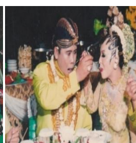
Gambar 16. Suapan