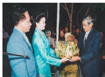
Gambar 7. Pisang Sanggan