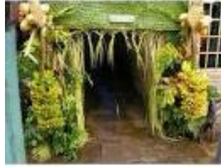
Gambar 2. Kerun/Gapura