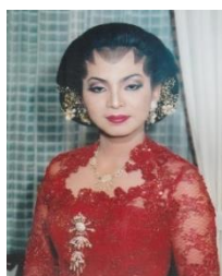
Gambar 6. Pingitan