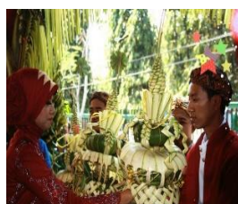
Gambar 10. Kembar mayang