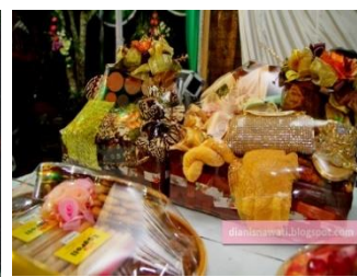
Gambar 8. Oleh-oleh

Tahap inti adalah ijab kabul. Acara ijab kabul adalah acara resmi pernikahan. Acara ini dilakukan oleh orang tua atau wali perempuan disaksikan pegawai Kantor Urusan Agama (KUA) sebagai petugas pencatatan dalam buku nikah. Pada saat ijab kabul, bahasa nonverbal orang tua mempelai wanita berhadapan dengan mempelai pria dan saling berjabat tangan. Mempelai wanita berada di sebelah kiri mempelai pria. Biasanya didampingi petugas dari KUA untuk mencatat keabsahan ijab kabul kedua pasangan dan memberikan buku nikah kepada kedua mempelai. Orang tua mempelai perempuan dalam posisi berhadapan dengan mempelai pria dengan tangan kanan saling berjabat tangan. Pada saat itulah, orang tua pria mengucapkan kata-kata ijab kabul ( Gambar 9: ijab kabul ). Konteks: acara ijab kabul di samping ada bahasa nonverbal statis juga ada bahasa verbal karena orang tua mempelai wanita mengucapkan kata-kata ijab kabul (Sari, 2017).